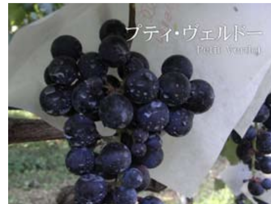
プティ・ヴェルドー Petit Verdot

フランス原産で、世界的に広く栽培されている 赤ワイン品種。 特にフランス・ボルドーが有名。 10月中～下旬に収穫。 果実は果皮が厚く、ワインはタンニンを豊富に含む ため、長い熟成にも耐えるといわれる。 味わいの複雑さがワインの骨格をつくる。