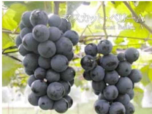
マスカット・ベリーA Muscat Bailey A

世界的に知られた白ワイン品種で、特にフランスや ニュージーランドが有名。 日本でも栽培地域が増えてきている注目の品種。 ワインにはレモンやグレープフルーツ、柚子など 柑橘系の香り、ハーブのようなさわやかな香りがある。