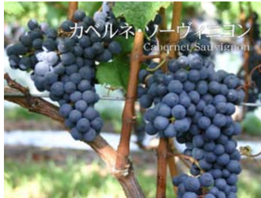
カベルネ・ソーヴィニオン Cabernet Sauvignon

フランス原産で世界的に広く栽培される赤ワインの 品種。 特にフランス・ボルドーが有名。 9月下～10月上旬に収穫。 肉付きを与えるブドウといわれ、ワインにふくらみや 味わいを与える品種。