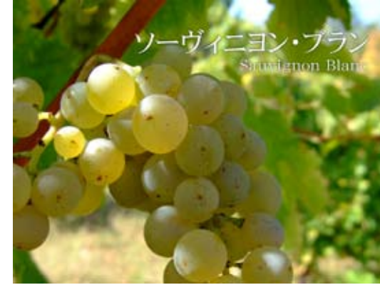
ソーヴィニオン・ブラン Sauvignon Blanc

世界的に広く栽培されている白ワイン品種。 シャブリやモンラッシェが有名。 ワインにはレモンや洋ナシ、杏などの果実香と、 樽で熟成させることが多いため、トーストやバニラの 香りがある。 また、バターやタルトなどの香りもある。