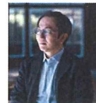
くらもぼんワイン 野沢